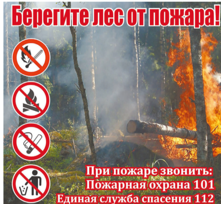
СПб ГКУ «ПСО Василеостровского района», Василеостровское отделение Санкт-Петербургского отделения ООО «ВДПО»

Закройте двери и окна, так как потоки воздуха питают огонь, отключите газ, электричество. Если потушить пламя невозможно, после спасения людей следует убрать баллоны с газом, автомобили, все легковоспламеняющиеся материалы.